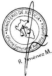
EDA A. RIVAS FRANCHINI Ministra de Justicia y Derechos Humanos